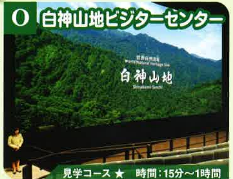
O 白神山地ビジターセンター