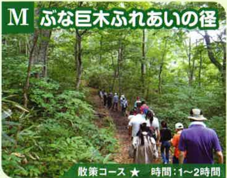
M ぶな巨木ふれあいの径