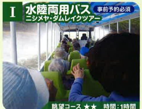
I 水陸両用バス 事前予約必須 ニシメヤ・ダムレイクツアー