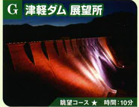
G 津軽ダム 展望所