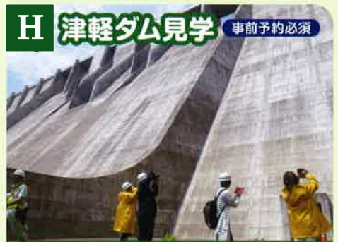
H 津軽ダム見学 事前予約必須