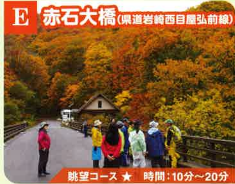
E 赤石大橋 (東道岩崎西目屋弘前線)