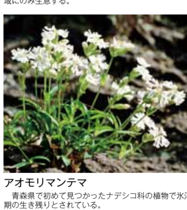
アオモリマンテマ